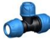
iJOINT T-Stück 90° reduziert ÖVGW-geprüft, REG Nr. W1.564 86 20 01 ...