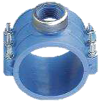
PP-Anbohrschelle mit Innengewinde

d 20-32 O-Ring NBR, ab d 40 Flachdichtung NBR, PN 16-10