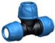
iJOINT T-Stück 90° ÖVGW-geprüft, REG Nr. W1.564 86 20 01 ...