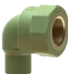
PP-R/Rg Winkel 90° Schweißstutzen / zyl. Innengewinde