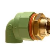
PP-R/Rg Hohlwandwinkel 90° Schweißmuffe / zyl. Innengewinde