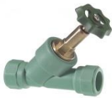
PP-R Schrägsitzventil mit kombiniertem Freistrom- Rückschlagventil ohne Entleerung