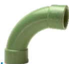
PP-R Bogen 90° mit beidseitiger Schweißmuffe