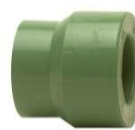
PP-R Reduktion Schweißmuffe / -stutzen