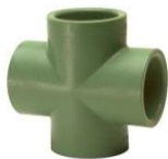
PP-R Kreuz mit allseitiger Schweißmuffe