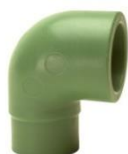
PP-R Winkel I/A 90° Schweißmuffe / -stutzen