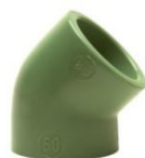
PP-R Winkel 45° mit beidseitiger Schweißmuffe