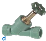
PP-R Schrägsitzventil ohne Entleerung