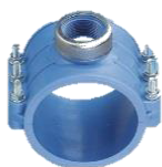
PP-Anbohrschelle mit Innengewinde

d 20-32 O-Ring NBR, ab d 40 Flachdichtung NBR, PN 16-10