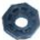
PP-Reduktion kurz Außen-Innengewinde