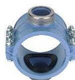
PP-Doppel-Anbohrschelle mit Innengewinde