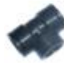
PP-T-Stück 90° Innengewinde